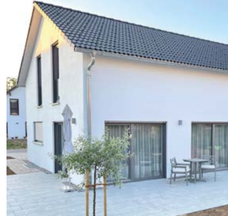
Die jungen Bauherren lieben ganz besonders die großen, bodentiefen Fenster zur Terrasse. Und freuen sich daher schon auf den Sommer, wenn sie dort die Zeit gemeinsam verbringen.

Besonders viel Zeit verbringt Familie Menkó im offenen Wohn-/Essbereich, der einen direkten Zugang zum Garten bietet. Gleichzeitig schenken die großen Fenster viel natürliches Licht.